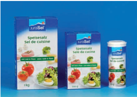
Fluoridiertes und jodiertes Speisesalz.

Geringe Mengen von Fluorid sind im Trinkwasser und in Lebensmitteln vorhanden. Die Fluoridkonzentrationen sind aber im allgemeinen sehr niedrig, so dass keine kariesvorbeugende Wirkung auftreten kann. Für einen wirksamen Kariesschutz steht in der Schweiz seit 1983 das jodierte und fluoridierte Speisesalz zur Verfügung (JuraSel im Paket mit grünem Streifen, das 0,025% Fluorid enthält). Zur Grundvorbeugung gehört auch die tägliche Benützung von fluoridhaltiger Zahnpaste.